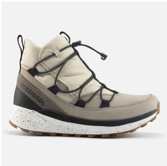
Rossignol W RESORT-DUNE-boty