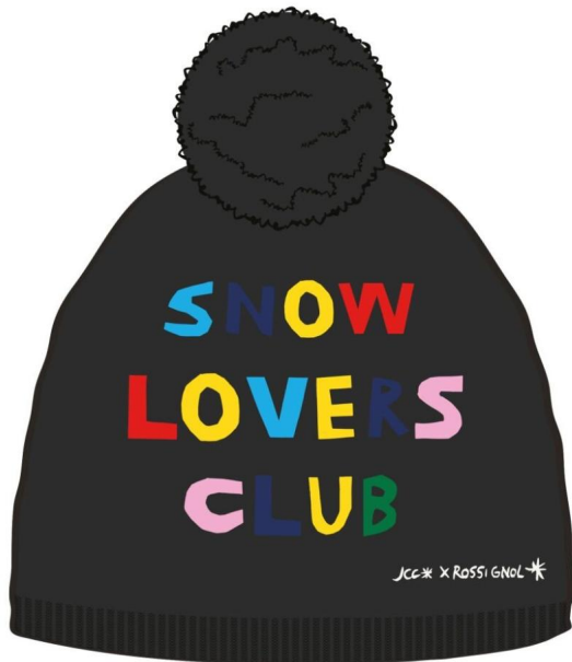
Rossignol W JCC MISSY-BLACK-šepice