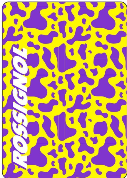
Rossignol SUPER NECK WARMER-COWNO SUPER YELLOW PRINT-