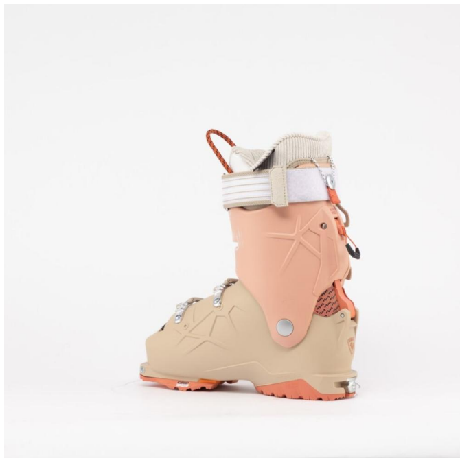
Rossignol ALLTRACK PRO 100 LT W GW - EAR-sjezd.boty