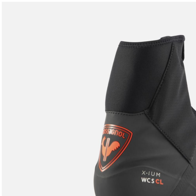
Rossignol X-IUM WCS CLASSIC -XC boty