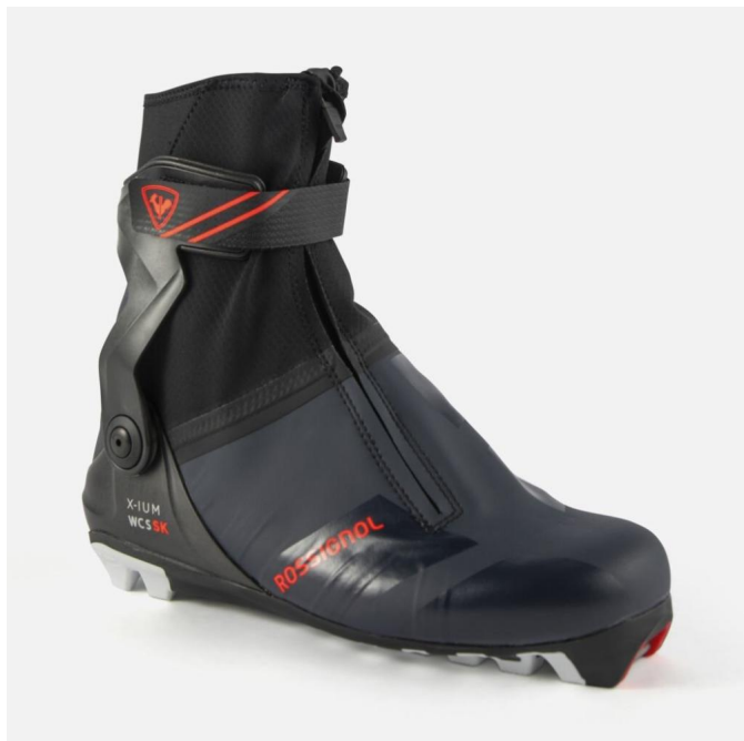
Rossignol X-IUM WCS SKATE FW -XC boty