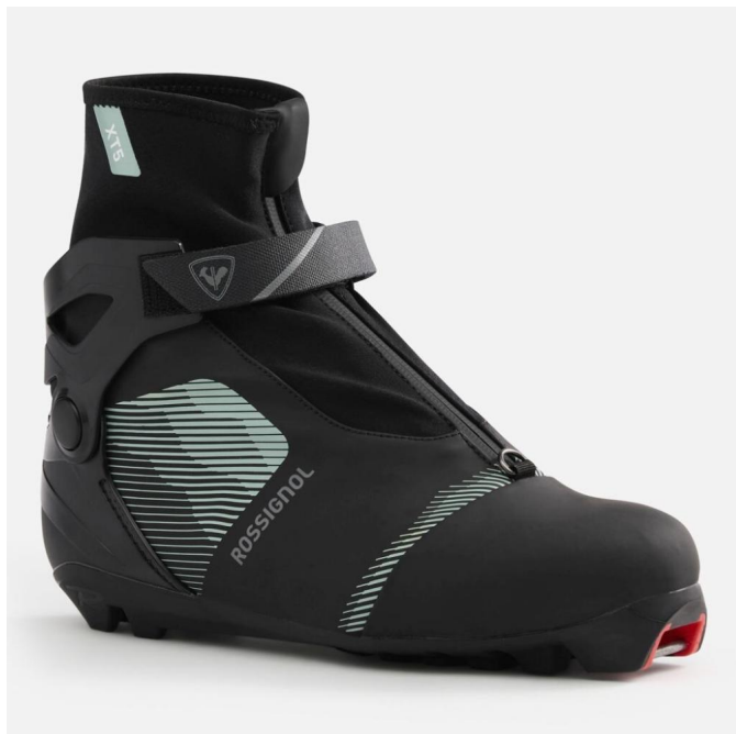
Rossignol XT 5 FW -XC boty