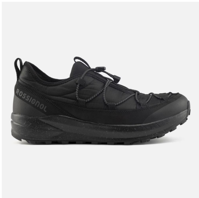
Rossignol RESORT LOW-BLACK-boty