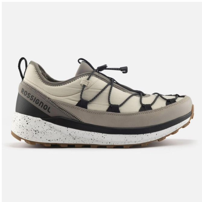
Rossignol RESORT LOW-DUNE-boty