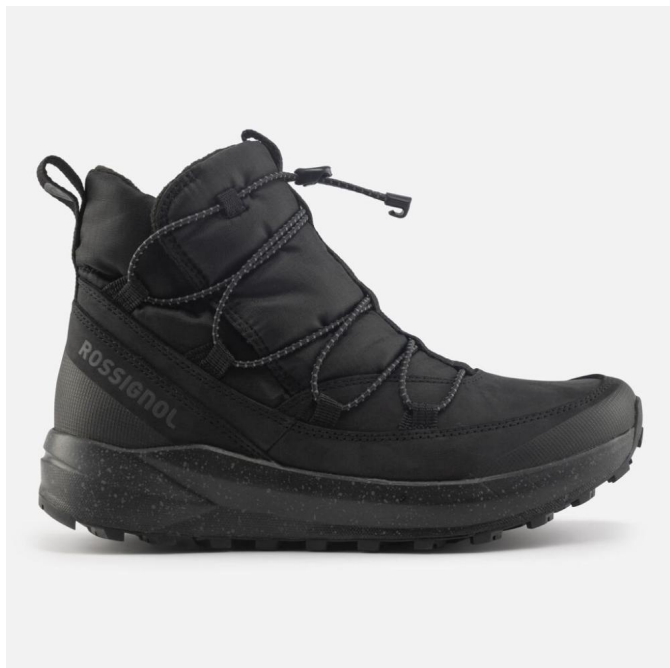
Rossignol W RESORT-BLACK-boty