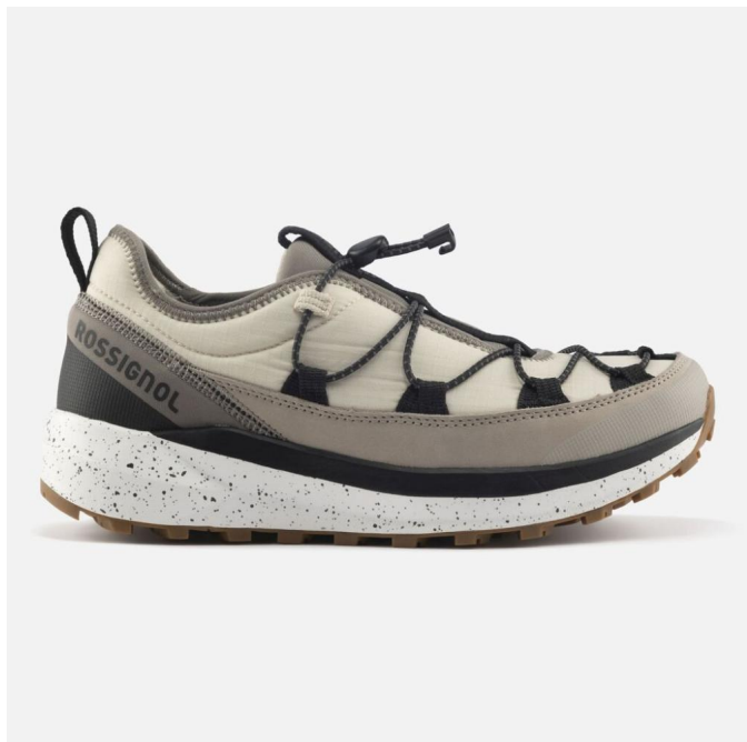
Rossignol W RESORT LOW-DUNE-boty