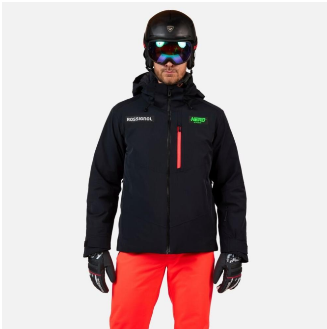
Rossignol HERO BLACKSIDE INSULATED JKT-BLACK-bunda