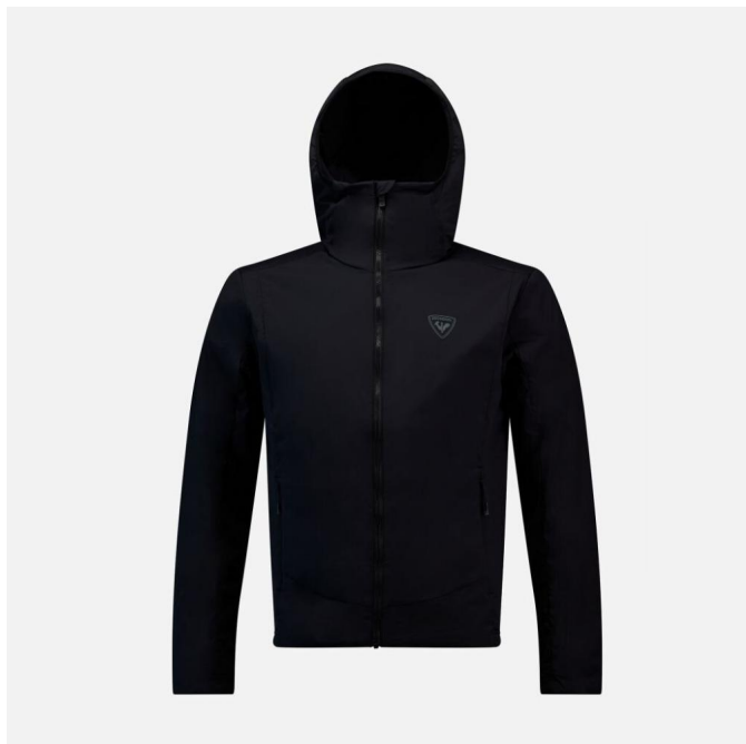
Rossignol OPSIDE HOODIE JKT-BLACK-bunda