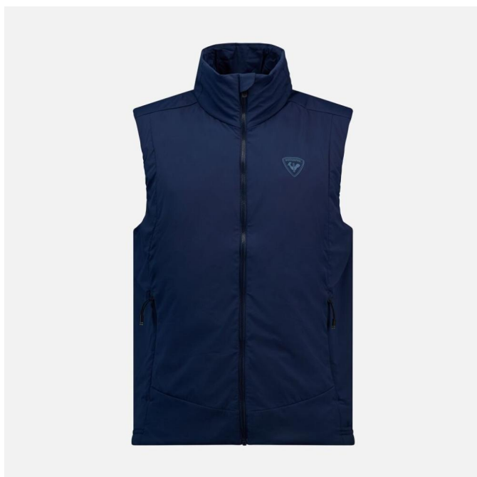
Rossignol OPSIDE VEST-DARK NAVY-bunda