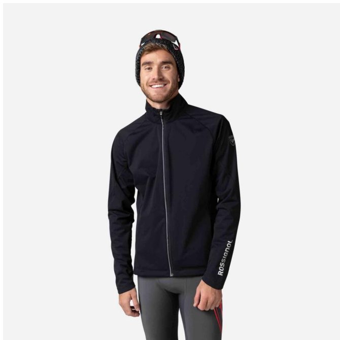
Rossignol POURSUITE JKT-BLACK-bunda