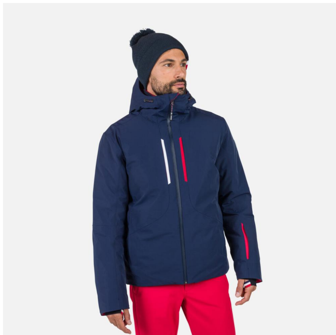
Rossignol DIRETTA JKT-DARK NAVY-bunda