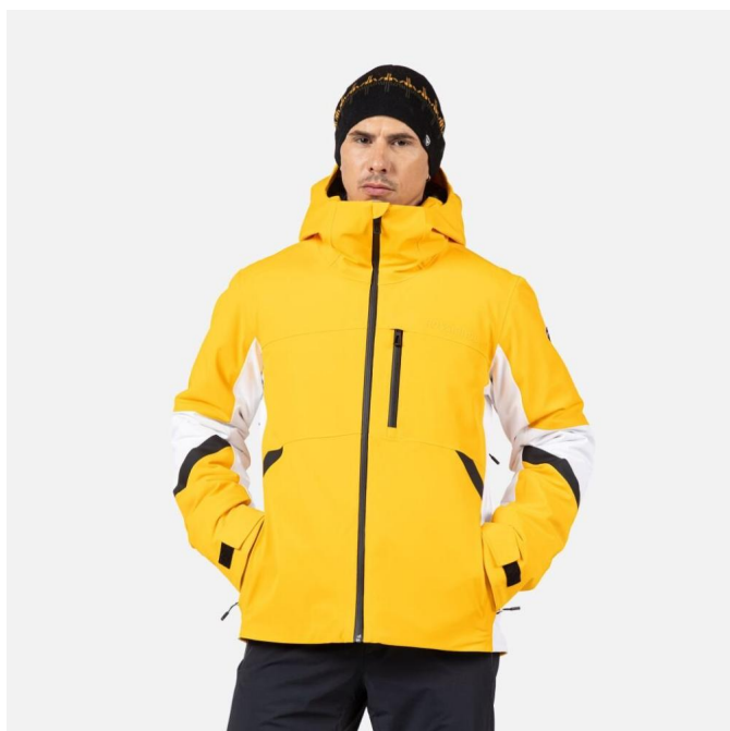
Rossignol CIASTEL JKT-SAFFRON YLW-bunda