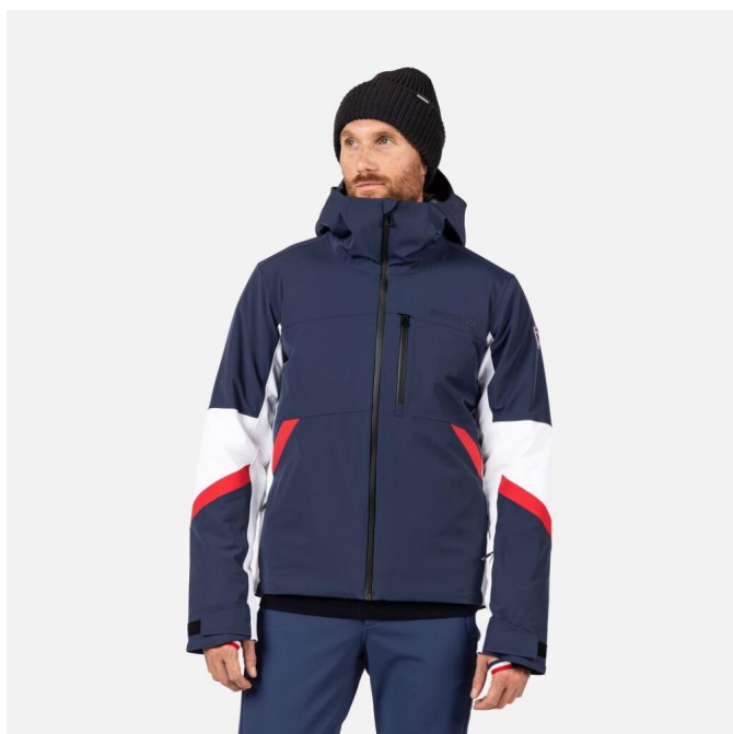
Rossignol CIASTEL JKT-DARK NAVY-bunda