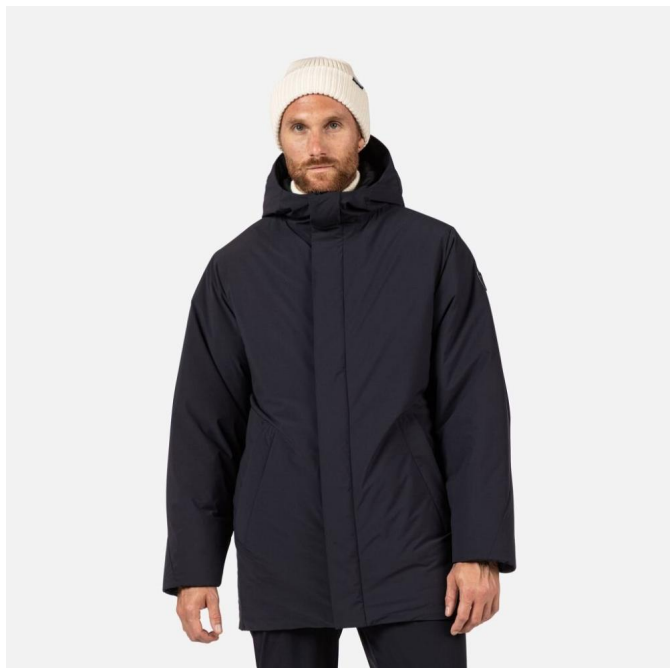
Rossignol CHAVANETTE INSULATED PARKA-BLACK-bunda