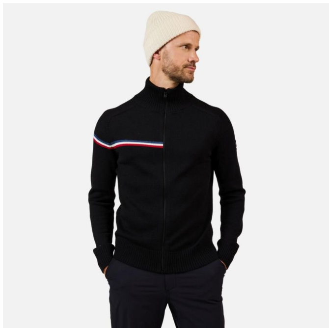
Rossignol ODYSSEUS FZ MERINO SWEATER-BLACK-triko