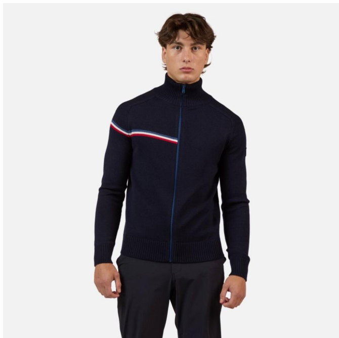
Rossignol ODYSSEUS FZ MERINO SWEATER-DARK NAVY-triko