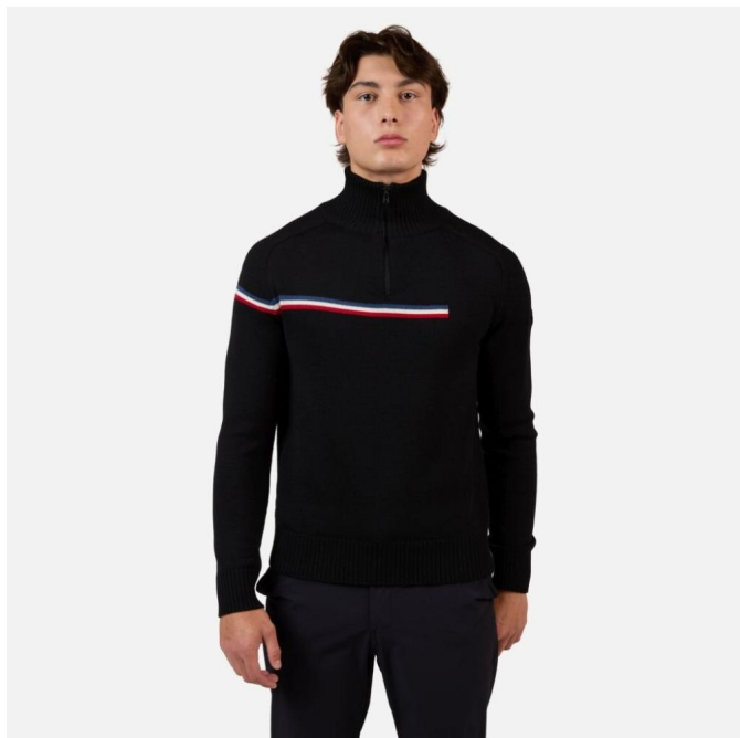
Rossignol ODYSSEUS HZ MERINO SWEATER-BLACK-triko