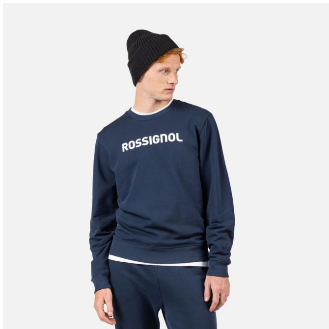
Rossignol PRARION CN SWEATSHIRT-DARK NAVY-mikina