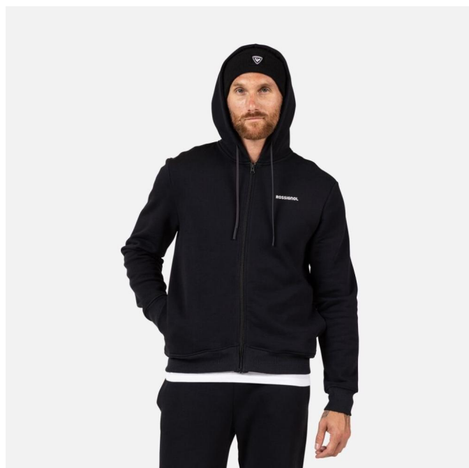
Rossignol PRESSET FZH SWEATSHIRT-BLACK-mikina