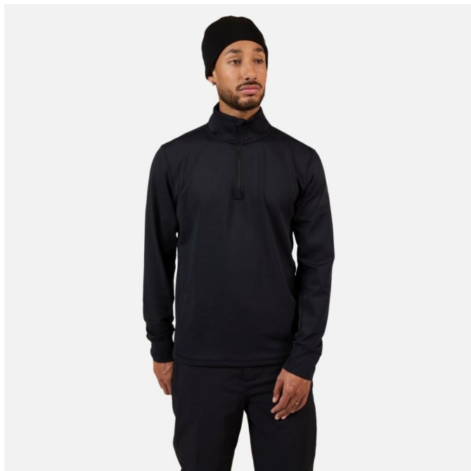
Rossignol MID LAYER STRETCH HZ-BLACK-mikina