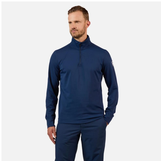
Rossignol MID LAYER STRETCH HZ-DARK NAVY-mikina