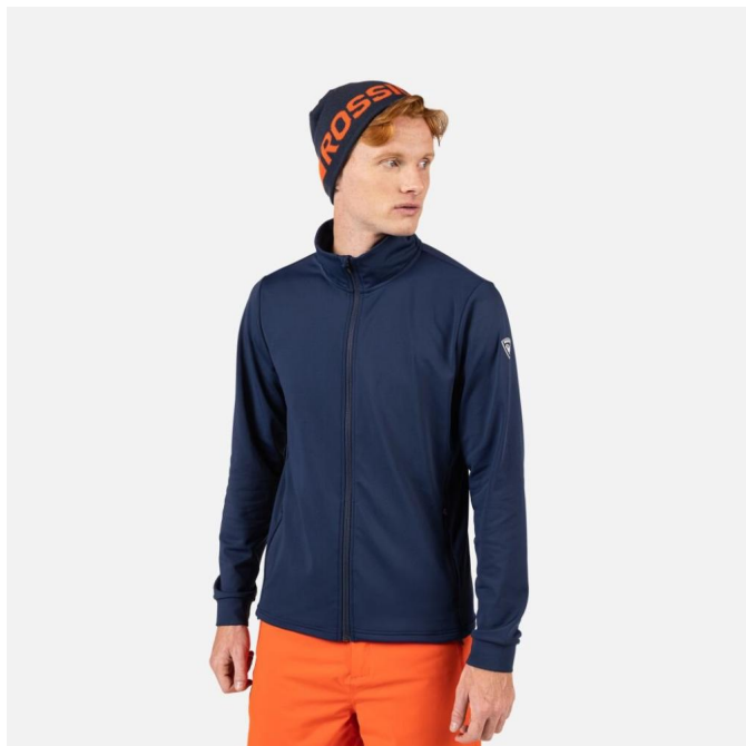
Rossignol MID LAYER STRETCH JKT-DARK NAVY-mikina