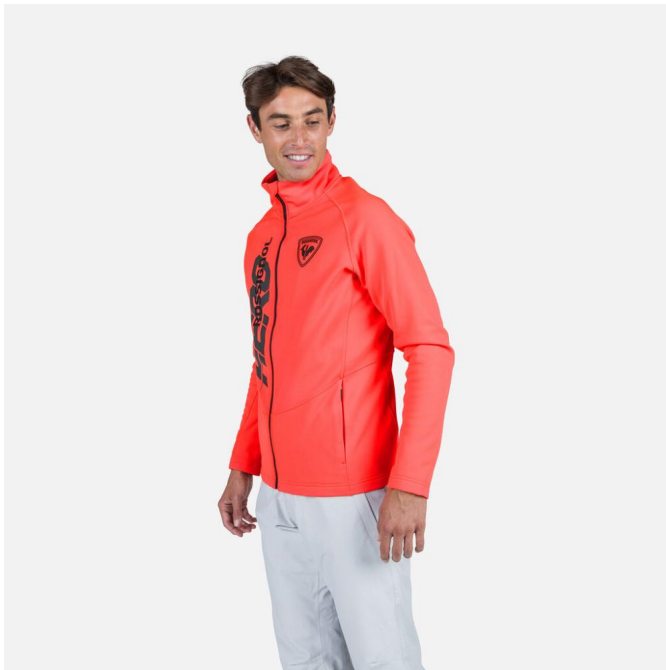
Rossignol NEW HERO CLASSIQUE CLIM-NEON RED-mikina