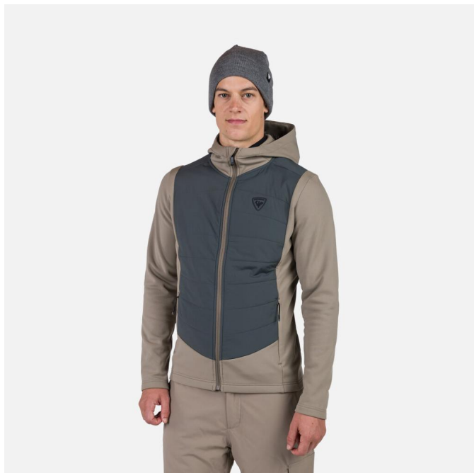
Rossignol CLASSIQUE HYBRID CLIM-DUNE-mikina