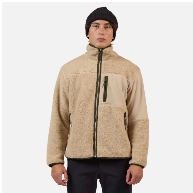
Rossignol ALLTRACK FZ SHERPA JKT-FOG-mikina