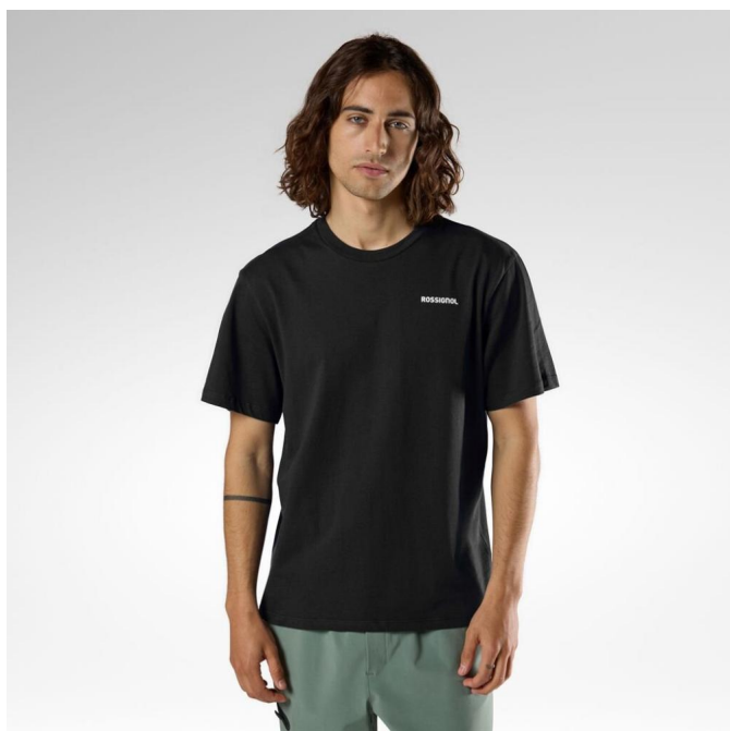
Rossignol PRESSET TEE-BLACK-triko