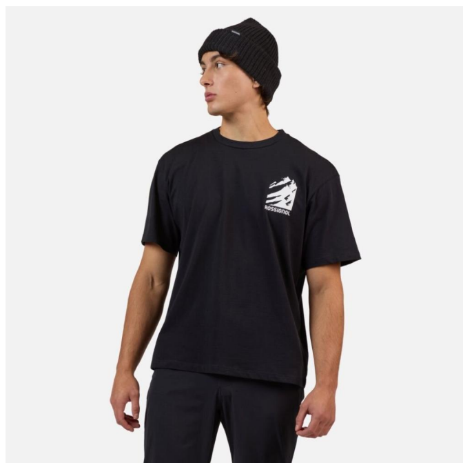
Rossignol WATERFALL RELAX TEE-BLACK-triko