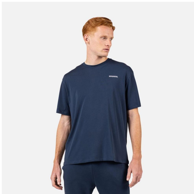
Rossignol WATERFALL RELAX TEE-DARK NAVY-triko