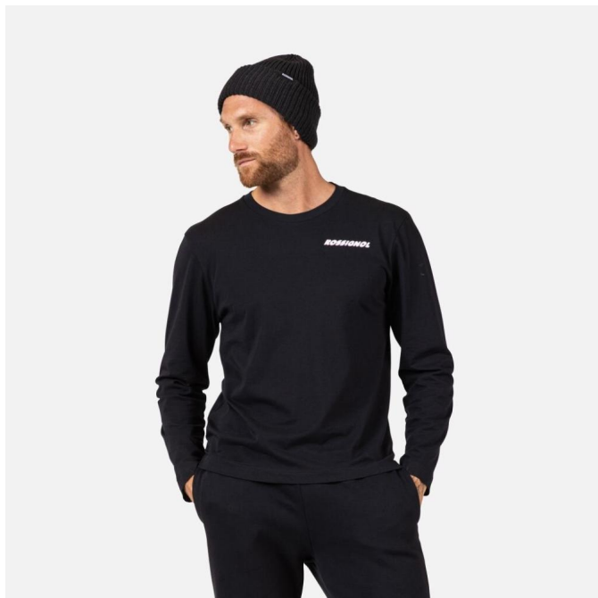
Rossignol LONG SLEEVE TEE-BLACK-triko