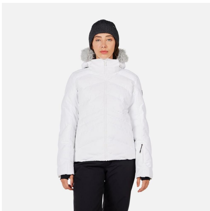
Rossignol W STACI INSULATED JKT-WHITE-bunda