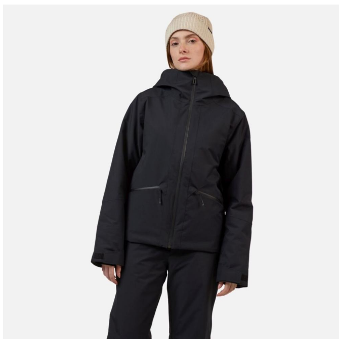
Rossignol W ROCHRUN INSULATED JKT-BLACK-bunda