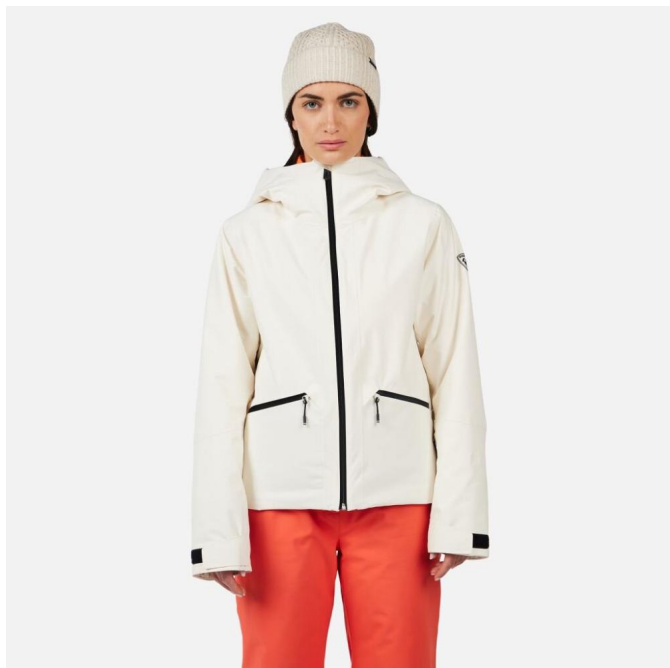
Rossignol W ROCHRUN INSULATED JKT-NATURE WHITE-bunda