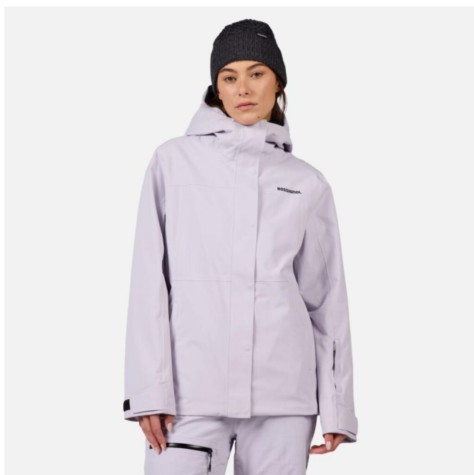
Rossignol W DESAFIO 2L SHELL JKT-GALACTIC LILAC-bunda