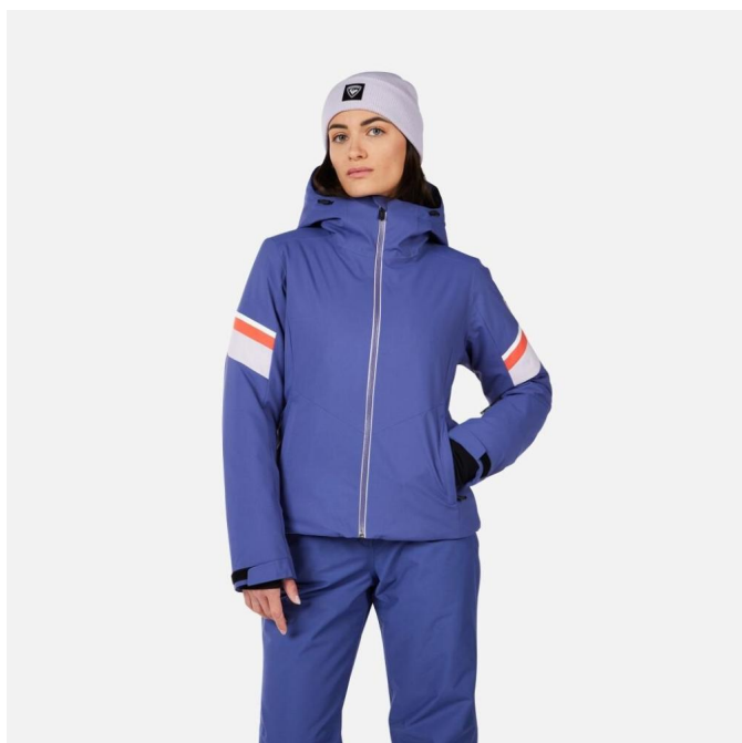
Rossignol W STRAWPILE JKT-FUTURE BLUE-bunda