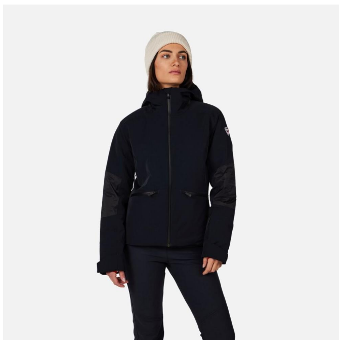
Rossignol W CIASTEL JKT-BLACK-bunda