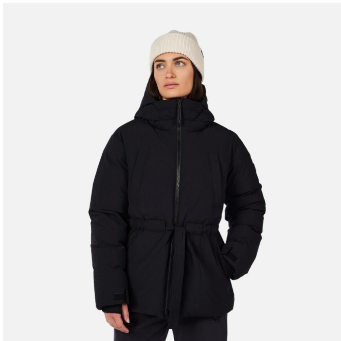
Rossignol W CHAVANETTE DOWN PARKA-BLACK-bunda