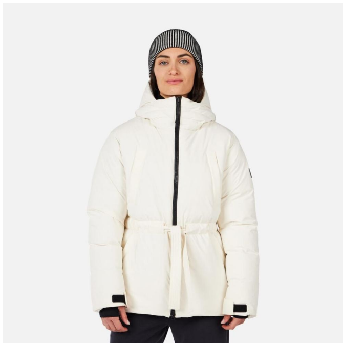
Rossignol W CHAVANETTE DOWN PARKA-NATURE WHITE-bunda