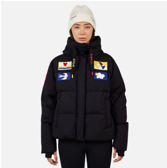
Rossignol W JCC ALLSNOW DOWN JKT-BLACK-bunda