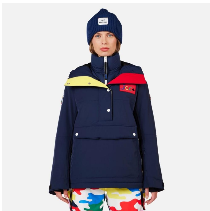
Rossignol W JCC VALTHOR JKT-COSMIC BLUE-bunda