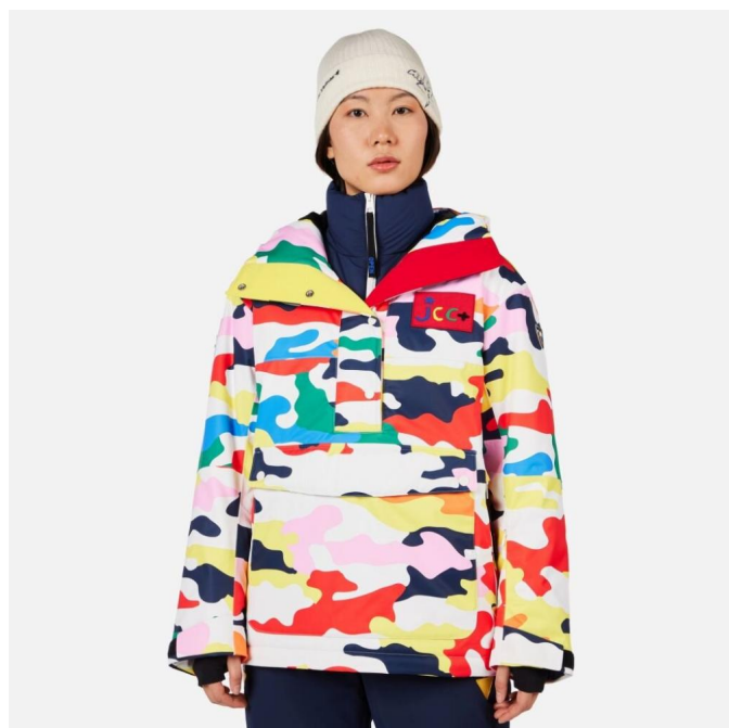
Rossignol W JCC VALTHOR JKT-JCC CAMO PRINT-bunda