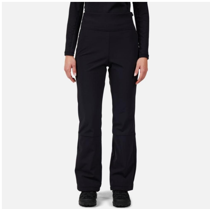
Rossignol W SKI SOFTSHELL PANT-BLACK-kalhoty