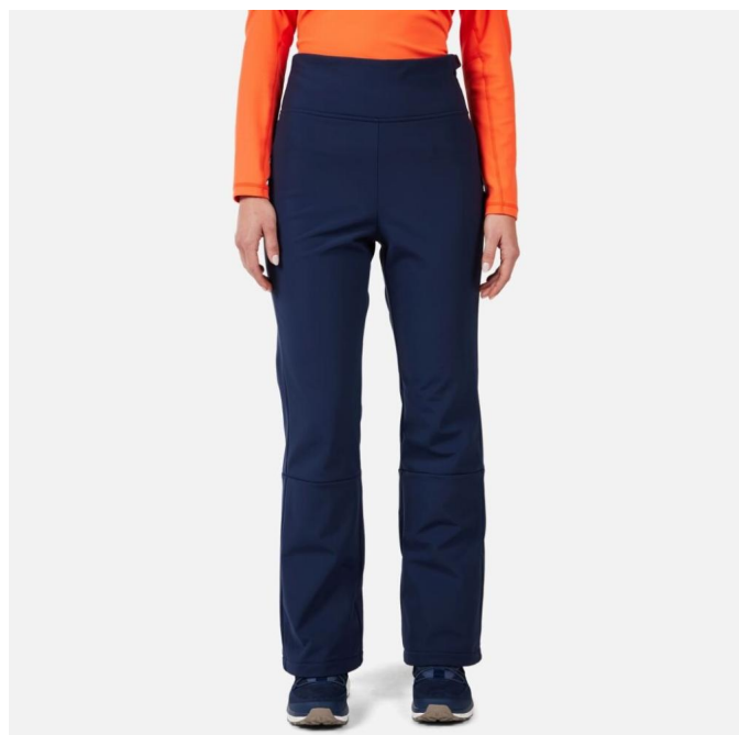
Rossignol W SKI SOFTSHELL PANT-DARK NAVY-kalhoty