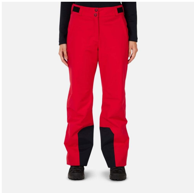
Rossignol W INSULATED SKI PANT-RUBY RED-kalhoty