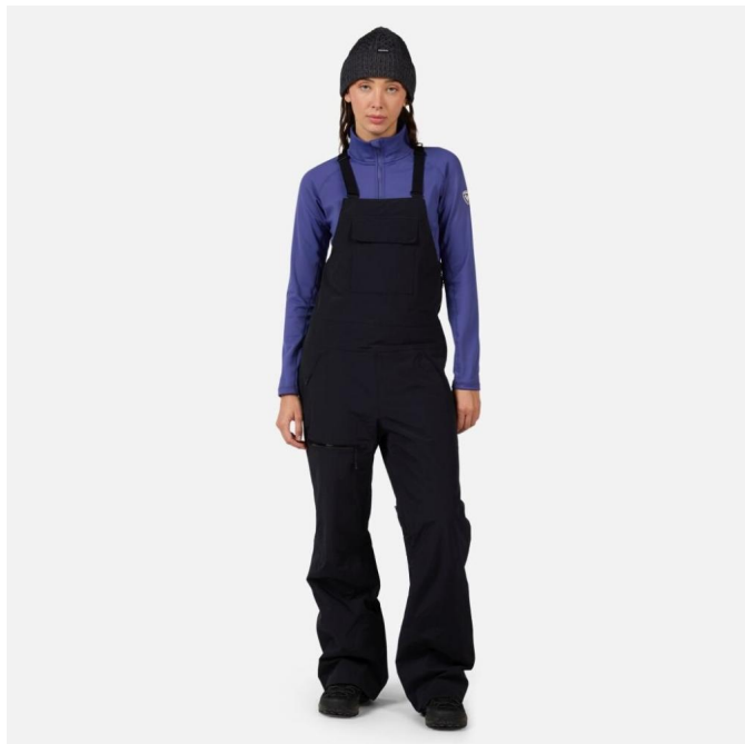
Rossignol W OUTERLIMITS INSULATED BIB-BLACK-kalhoty