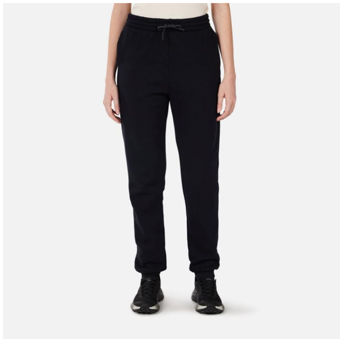
Rossignol W PRESSET PULLON PANT-BLACK-kalhoty